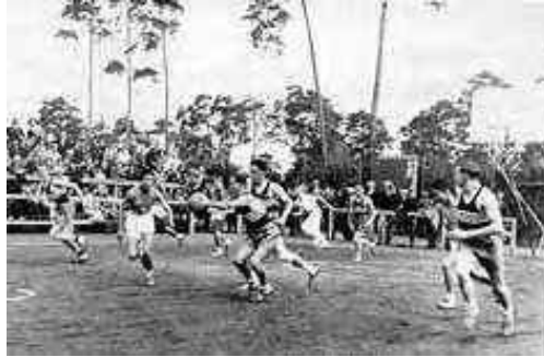
- Aux Jeux Olympiques de 1936 à Berlin -

En 1936 fut supprimé l'entre-deux au milieu du terrain après chaque panier marqué et le basket-ball fit son apparition aux Jeux Olympiques de Berlin.